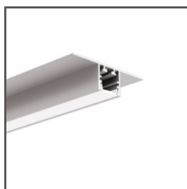
PDS-T A02057 Ref. arch C2057