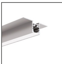
PDS-UST A02725 Ref. arch C2725