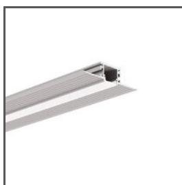
KOZMA A18040 Ref. arch 18040