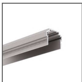
TEKNIK-ZM-TK A01554 Ref. arch C1554