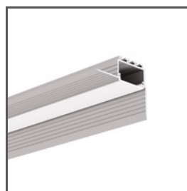
KOZUS-CR A00600 Ref. arch C0600