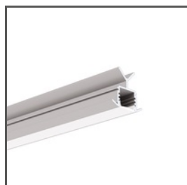
POR A06144 Ref. arch B6144