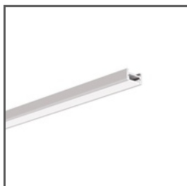
MICRO-H A00599 Ref. arch C0599