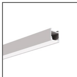
PDS-H A0920 Ref. arch B9204