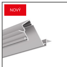
DIPOKET A01177 Ref. arch H1177