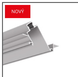
POKET A01179 Ref. arch H1179