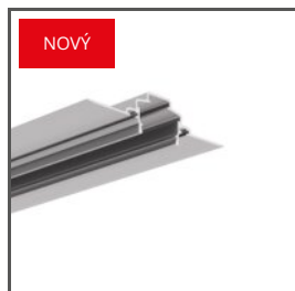
FASKO A04323 Ref. arch C4323