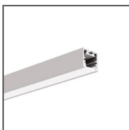
PDS-ZM-PLUS A02056 Ref. arch C2056