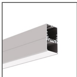
4050-W A18051 Ref. arch 18051