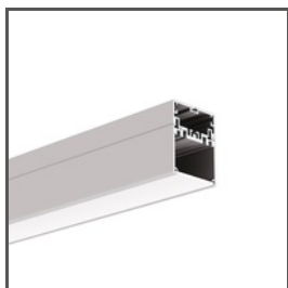
4050 A18050 Ref. arch 18050