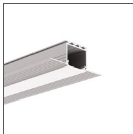
KOZEL A06454 Ref. arch B6454