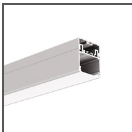
3035 A18039 Ref. arch 18039