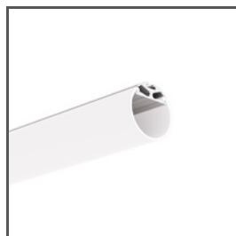
JAZ A08547 Ref. arch B8547