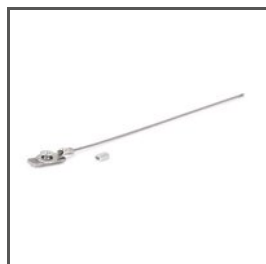
BEZPEČNOSTNÍ KABEL ZM-2 Z70521 Ref. arch 70521