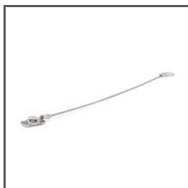
BEZPEČNOSTNÍ KABEL ZM-1 Z70520 Ref. arch 70520