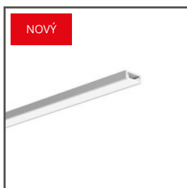
MICRO-PLUS A02966 Ref. arch C2966