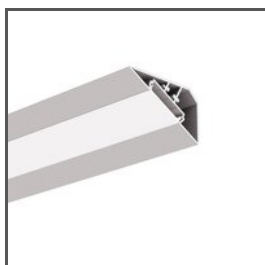
LOC-30 A18015 Ref. arch 18015