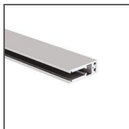
KRAV-56 A18017AZM Ref. arch 18017