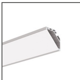
KOPRO A06367 Ref. arch B6367