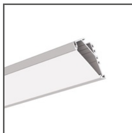
KOPRO-30 A07890 Ref. arch B7890