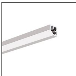
KUBIK-45 A07697 Ref. arch B7697