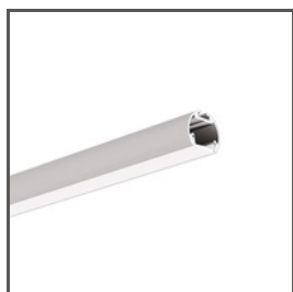
OLEK A08505 Ref. arch B8505