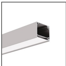
IKON A18013 Ref. arch 18013