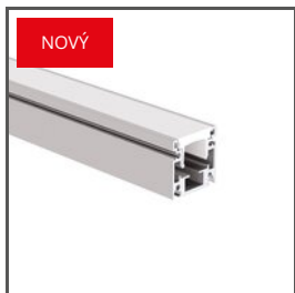
HR-OPTI A01844 Ref. arch C1844