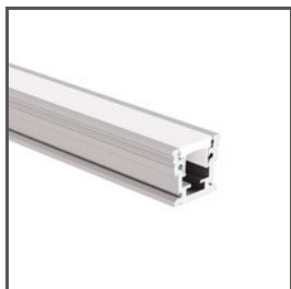
HR-MAX A01829 Ref. arch C1829