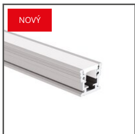
HR-MAX A01829+A01827+A01828 Ref. arch C1829+C1827+C1828