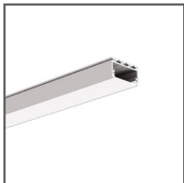
GIZA-LL A00758 Ref. arch C0758