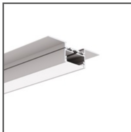
GIZA-LL-UST A02724N Ref. arch C2724