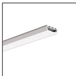
GIZA A05556 Ref. arch B5556