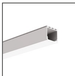
LIPOD A05554 Ref. arch B5554