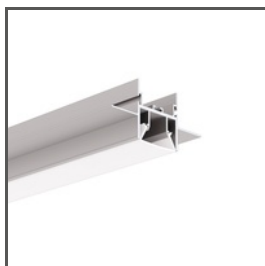
FOLED A08332V1 Ref. arch B8332V1