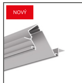
DIPOKET A01177 Ref. arch H1177