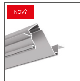
DIPOK-US A01233 Ref. arch H1233