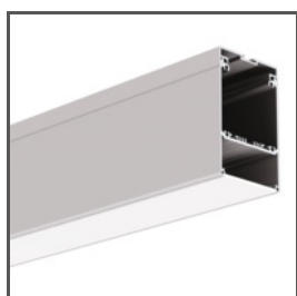
GLADES A18036 Ref. arch 18036