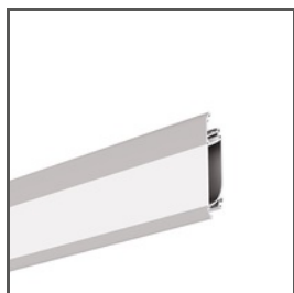
OBIT A04826 Ref. arch W4826