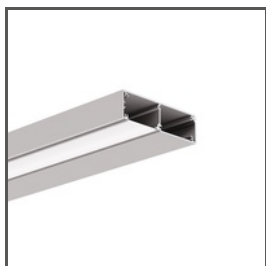
KIDES A18031 Ref. arch 18031