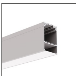
DES A18030 Ref. arch 18030