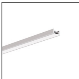
MICRO-H A00599 Ref. arch C0599