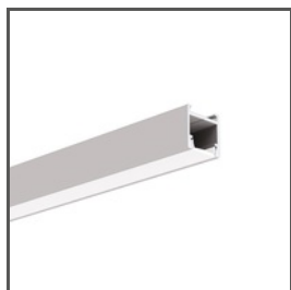
PDS-H A0920 Ref. arch B9204