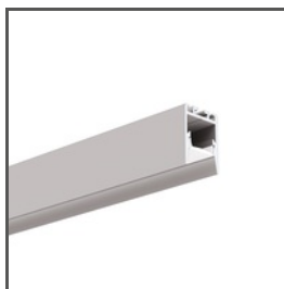
PDS-ZMG A01418 Ref. arch C1418