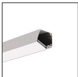
IMET A18012 Ref. arch 18012