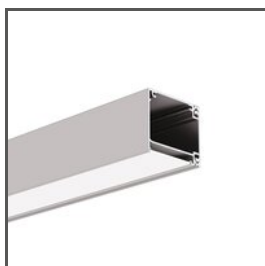
IKON A18013 Ref. arch 18013