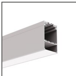
DES A18030 Ref. arch 18030